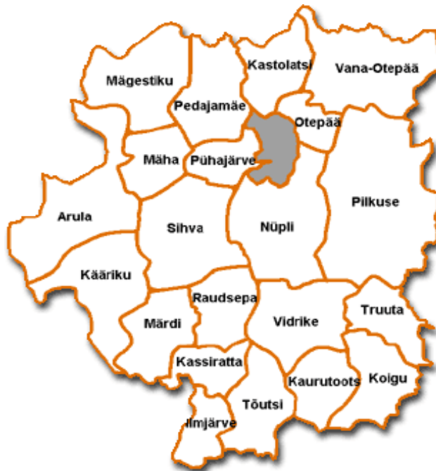
Kaart 3. Otepää valla külade kaart.

Küla keskuseks võiks lugeda tinglikult Ilmjärve kirikut. See asub Otepäält 15 km Sangaste poole sõites ja Sangastelt 8 km Otepää poole sõites.