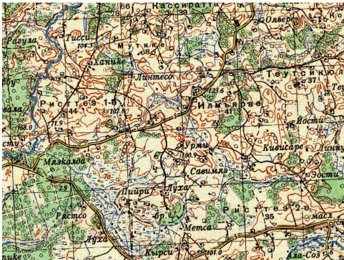
Kaart 1. 1939. a. Koostatud kaart, kus on viide ka Ilmjärve küla.