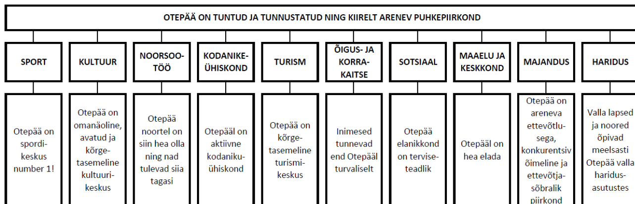
Joonis 1. Otepää valla Visioon

Visioon on toodud ära järgmise joonise (Joonis 1.) kujul, kus visiooni aitavad saavutada iga valdkonna üldeesmärgid.