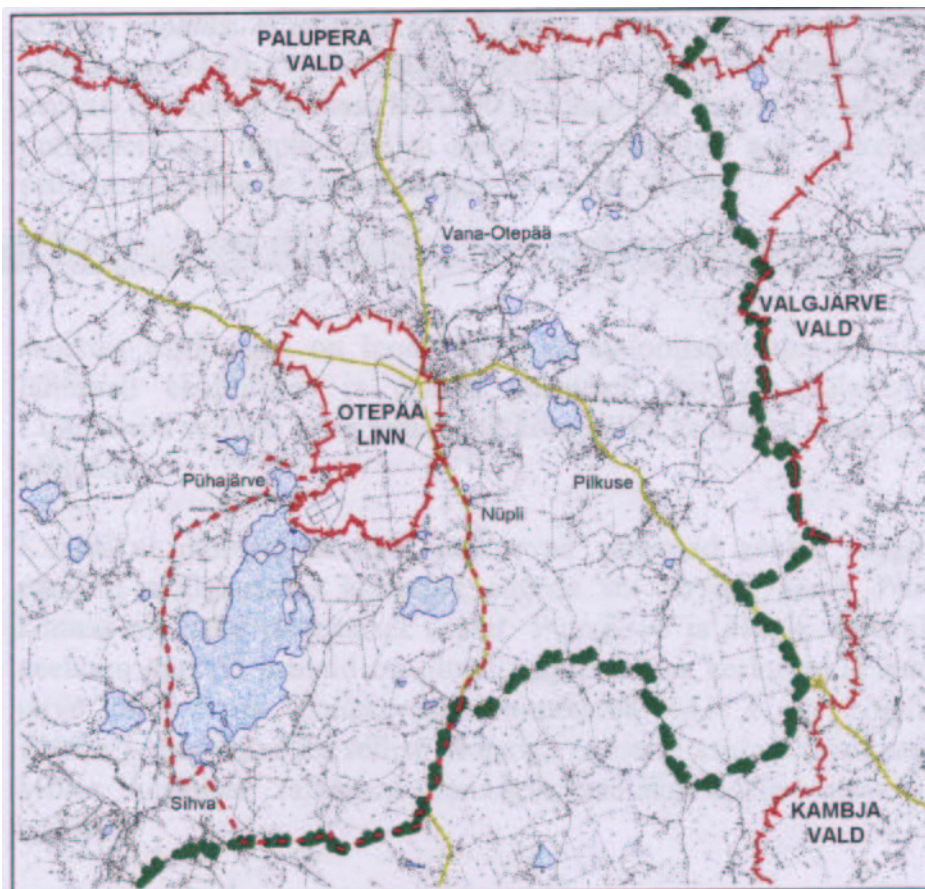
Joonis 1 Skeem planeeritava ala piiridest

Käesoleva osauüldplaneeringuga hõlmatav maa-ala asub valla keskosas. Osauüldplaneering hõlmab peamiselt Pühajärve ja Nüpli järve lähieümbriust ulatudes Otepää linna lõunapiirist kuni Sihva küla keskuseni (vt. joonis 1.). Piirkond on nii kodu kui välismaal tuntud kui suvise ja talvise puhkuse veetmise koht.